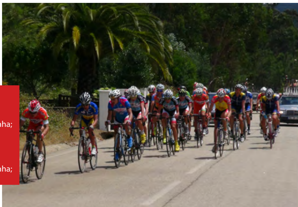
Neste segundo dia de competição as surpresas podem acontecer. Os candidatos à Volta terão de ter a máxima atenção.