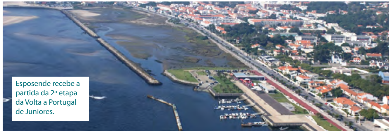
Esposende recebe a partida da 2ª etapa da Volta a Portugal de Juniores.

Braga acolhe o penúltimo final de etapa da Volta a Portugal de Juniores. Os corredores, que partiram de Esposende, têm a acidentada tarefa de cumprir os 104,6 km que separa o pano de partida do de chegada. Os mesmos são brindados com duas metas volantes, duas metas de montanha e duas passagens pela meta. Apesar da localidade de partida e da de chegada pertencerem ao mesmo distrito, as mesmas diferem bastante a nível de terreno.