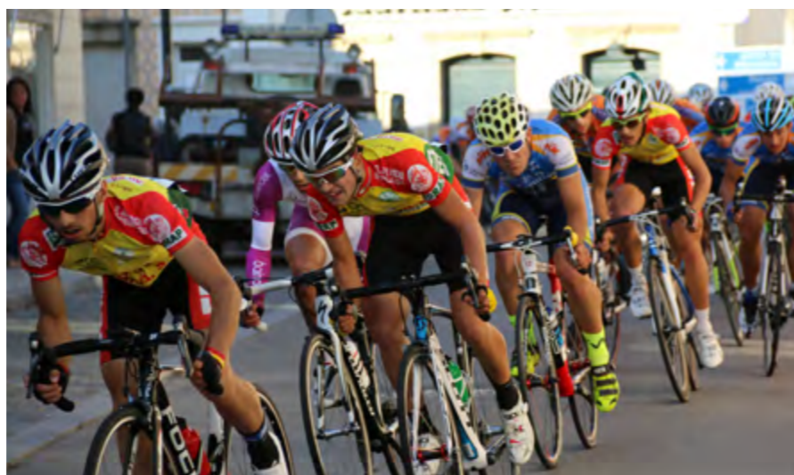
A primeira etapa é a mais tranquila das três ligações. É normalmente nestas etapas que as fugas dão resultado, tal como aconteceu na 1ª etapa da Volta a Portugal de Cadetes.